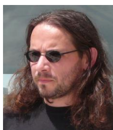
En grève d'inspiration, et maintenant d'encre