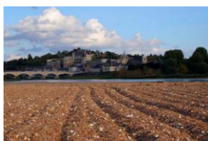
Grève : n.f. Terrain uni et sablonneux le long de la mer ou d'une grande rivière.