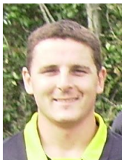
En grève de pied droit et aussi de gauche