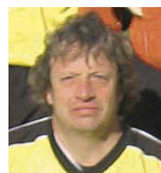
En grève d'alcool pour une longue longue longue durée Ouah ! Félicitations