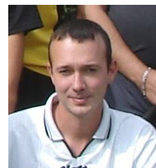
En grève de portemonnaie ? Non !! Joyeux anniversaire !