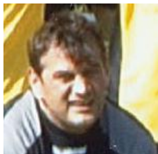
En grève de pote à Ballée