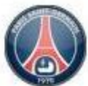
En grève de coupe d'Europe, quel dommage !