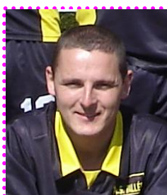
30 ans le 05 Septembre