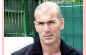
Zinedine Zidane (né à Marseille de parents Kabyle originaire d'Algérie)