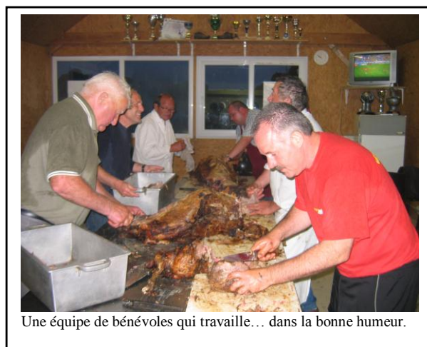
Une équipe de bénévoles qui travaille... dans la bonne humeur.