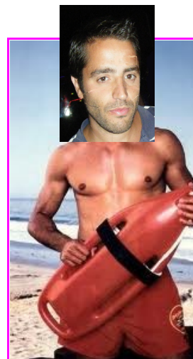
Alerte à Ma...th Lecourt : Joyeux Anniversaire

Baston : Le Comité d'Animation de Ballée organise le SAMEDI 27 OCTOBRE à 20 H 30 une soirée Châtaignes, à la salle des fêtes de Ballée. La compagnie "Le Moulin en Herbe" vous présentera une pièce de Théâtre "Le Magot du Mécano" suivie d'une dégustation de crêpes et châtaignes. L'entrée est de 7 € par adulte et 3.50 € par enfant de moins de 10 ans. Le prix comprend : le spectacle + 1 cornet de châtaignes + 1 crêpe + 1 verre de cidre ou de jus de pomme. Les cartes sont en ventes à l'épicerie VIVECO de Ballée ou chez Anne Leroy.